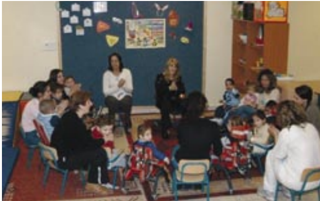
ילדי המעון עם הגנות