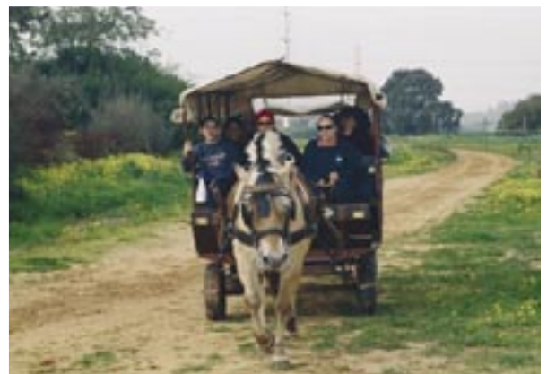
ילדי בית הספר "אלמנאר" והוריהם מטיילים בכרכרה