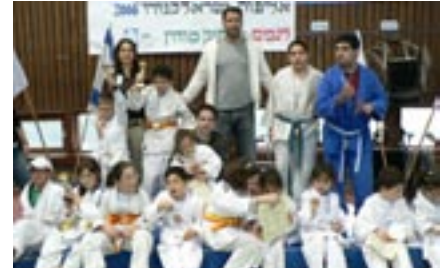
מתאבקי הג'ודו הצעירים עם המדליסט אריק זאבי והמדריכים המסורים מירב טייר ואיליה דמבינסקי

כ־50 ילדים ובני נוער נכים ממרכזי ספורט ברחבי הארץ השתתפו באליפות ישראל בג'ודו לילדים נכים שהתקיימה במרכז הספורט בסוף חודש מרץ. המדליסט האולימפי, אריק זאבי, כיבד את האירוע בנוכחותו ואמר כי הספורטאים הצעירים הם הלוחמים והגיבורים האמיתיים, מקור השראתו. התחרות התקיימה בהתאם לקבוצות הגיל ולרמות הנכות של הילדים, והמתחרים גילו רמה גבוהה. חוג הג'ודו במרכז הספורט תופס תאוצה בשנתיים האחרונות, ולצד הפעילות הספורטיבית הוא משלב פעילויות חברתיות ומחנה אימונים.