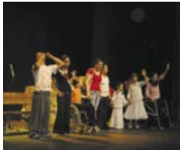
משתתפי ההצגה מודים לקהל