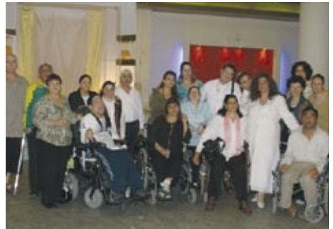
תמונה קבוצתית עם החתן והכלה