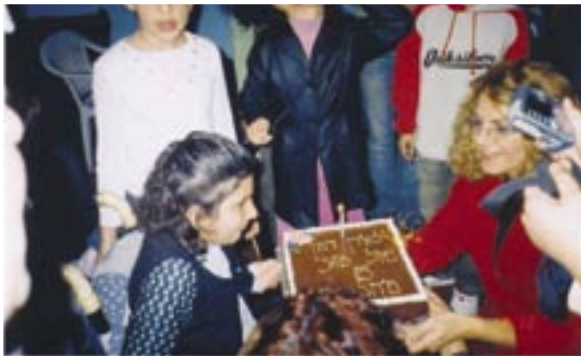
עוגת יום הולדת לשירן

מאת: מלי ברקוביץ', עו"ס סניף איל"ן פתח תקוה