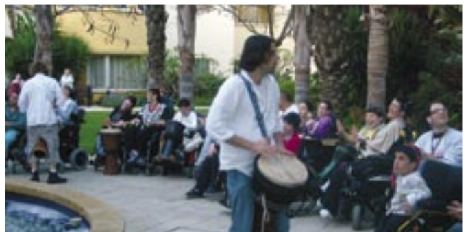
חגיגות יום העצמאות ב"בית קסלר"