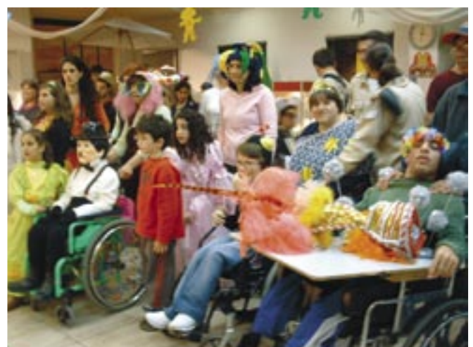
ילדי איל"ן חוגגים את חג הפורים ב"בית העובד" של "חברת החשמל" בחיפה

בתום הערב הודו הילדים ובני משפחותיהם שמסיבת פורים כזו נהדרת טרם נראתה במחוזותינו. תודה מקרב לב לוועד הצפוני של "חברת החשמל" על המאמצים שהושקעו, על היחס החם והאוהד לו זכה ילדינו ועל רוחב הלב ורוח ההתנדבות. כולם מצפים שבשנה הבאה עלינו לטובה שוב נוזמן לחגיגת פורים בשיתוף "חברת החשמל".