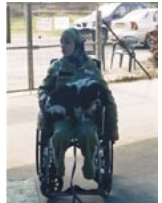
ילדה מבית הספר "אלמנאר" נהנית מטיפול בכלב ביום ההורים

כדי לעודד קידום מטרות אלה נערכו במרכז בתל מונד, בנוסף למפגשים השוטפים אחת לשבוע, יום עיון לאנשי מקצוע ושני ימי הורים לתלמידי בית הספר. ביום ההורים הראשון, שהתקיים בקיץ 2005, הייתה היענות מועטה יחסית מצד ההורים, אך אלה שהגיעו הביעו התרגשות ושמחה על השתתפות ילדיהם בפרויקט. יום ההורים השני נערך בפברואר 2006. הפעם קדמה לו עבודת הכנה רבה מצד צוות בית הספר ומחלקות החינוך והשירותים החברתיים בעיריית טירה. הכנה זו תרמה רבות להצלחת היום, שבו השתתפו כ-50 תלמידים ויותר מ-60 הורים. ההורים וילדיהם פעלו ביום זה בכמה תחנות, שכללו טיפול בבעלי חיים קטנים (שרקנים, תוכי, צב ועוד), טיפול בכלבים, רכיבה על סוסים וטיול בכרכרה. ההורים לקחו חלק פעיל בטיפול בבעלי החיים השונים, ונראה שנהנו מאוד משהותם עם הילדים ומהצפייה בהם. יום זה מהווה ציון דרך משמח ומעודד, המוכיח כי קיים פוטנציאל טיפולי וקהילתי רב הן בפעילות המועדונית בכלל, והן בפעילות המתקיימת במרכז בתל מונד בפרט. ברצוננו להודות מקרב לב לצוות הנפלא, החם והמסור של "המרכז לרכיבה טיפולית", לעובדי הלשכה לשירותים חברתיים בעיריית טירה, לתלמידינו ולהוריהם וכמובן - לעמותת איל"ן. בזכותכם תלמידינו מתקדמים, נהנים ומרחיבים אופקים!