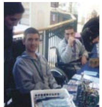
ילדי בית הספר "אופקים" בדון ב"גרנד קניון"

למשתתפי הפרויקט הותאמה תוכנית לימודים הכוללת פעילות של התנסות בעבודה בסדנאות יום רביעי. התלמידים בחרו בעצמם את התחומים שבהם רצו להתנסות, וכל אחד מהמשתתפים נבחר על ידי אחראי הסדנאות על פי כישוריו ויכולותיו. סדנאות המטבח, המזנון, התכשיטנות, כלי העץ, הציור, המחשבים והקריאה הפונקציונלית מתקיימות במקביל, והתוצרים נמכרים בבזארים בבית הספר ומדי חודשיים ב"גרנד קניון" בחיפה, לשם מגיעים המשתתפים כמוכרים, קופאי ואורזות בליווי שתי מורות. בנוסף מתקיימות לפי בקשת התלמידים סדנאות עיתון, שבו הם מעלים חוויות מעולמם, עוסקים באקטואליה ועוד.