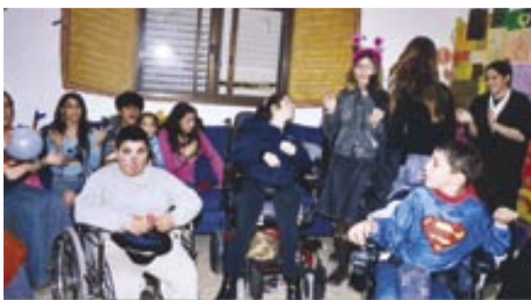
הילדים והנים במסיבת פורים

מלבד הפעילות במועדונית מתקיים בסניף איל"ן חוג פלדנקרייז לנכים, שבו משתתפים כ-15 נכים בגילאי 40 פלוס. "גלגלי הנס" (רחובות, נס ציונה, יבנה) הוא חוג ריקודי עם על כיסאות גלגלים, שנפתח לפני כארבעה חודשים וחצי והפך במהירות לחוג הגדול ביותר בארץ - כ-25 זוגות והיד עוד נטויה. בימי שישי מתכנסת קבוצת גברים נכי פוליו לשיחה על כוס בירה, ובתכנון הקמת קבוצה חברתית לנכים בוגרים.