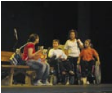
סצנה מההצגה "גן החלומות"

באהבה ובהערצה אסתי פרומוביץ, בשם בוגרי "יעלים"